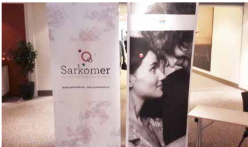
ROLLUP: SARKOMER OG HJERNESVULSTFORENINGEN

Takk til gode foredragsholdere og deltagere som bød på seg selv og sin kunnskap, og ikke minst: Takk til dere som er våre pårørende!