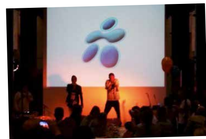
TO UNGE ARTISTER LØFTET STEMNINGEN YTTREligere UNDER PASIENTDAGEN DEN STORE KULE DAGEN 2014.